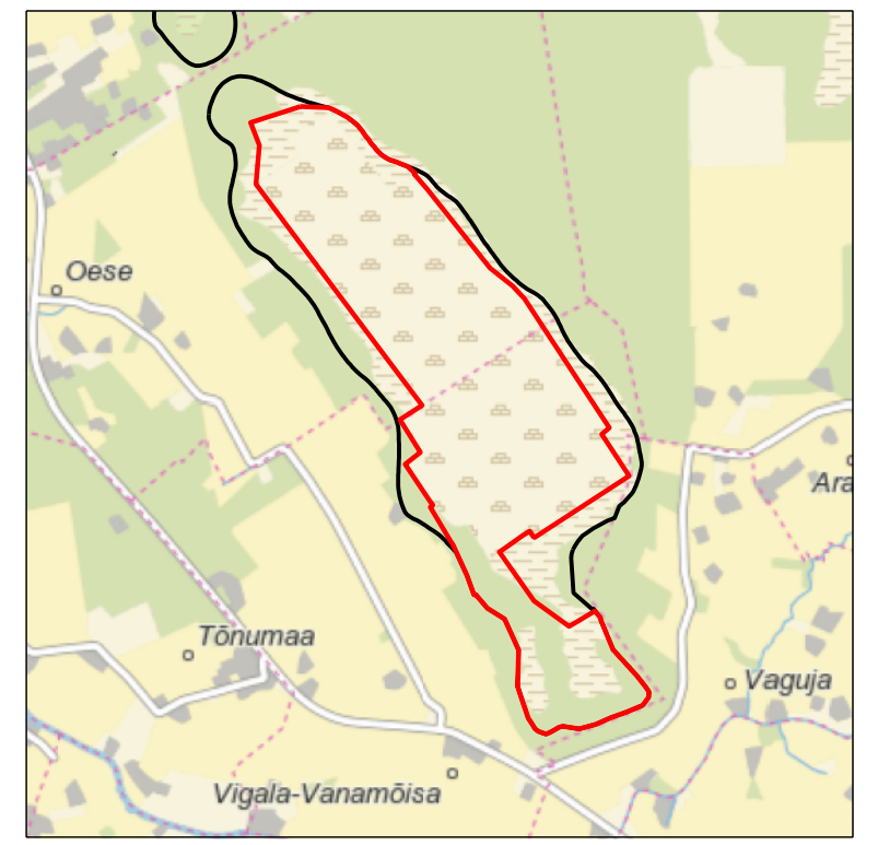
Kaardileht nr 6311 Vigala